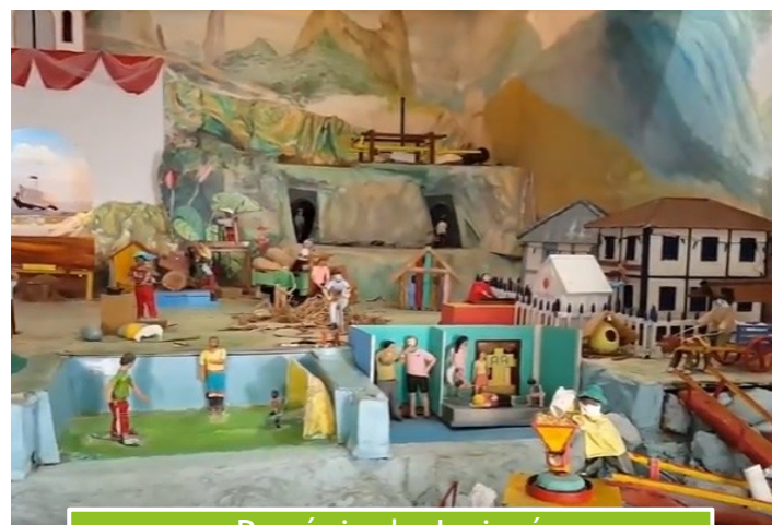
Presépio de Jaciguá