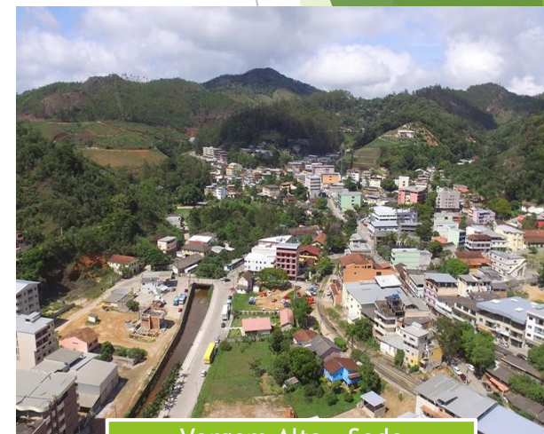
Vargem Alta - Sede

Portanto é necessário compreender que a estratégia em vigor da Câmara Municipal de Vargem Alta colabora com a escolha da melhor estratégia futura. Caso o processo de planejamento não leve em consideração a estratégia atual, a organização perderá todo o esforço e recursos aplicados na sua execução e poderá ocasionar uma descontinuidade na gestão.